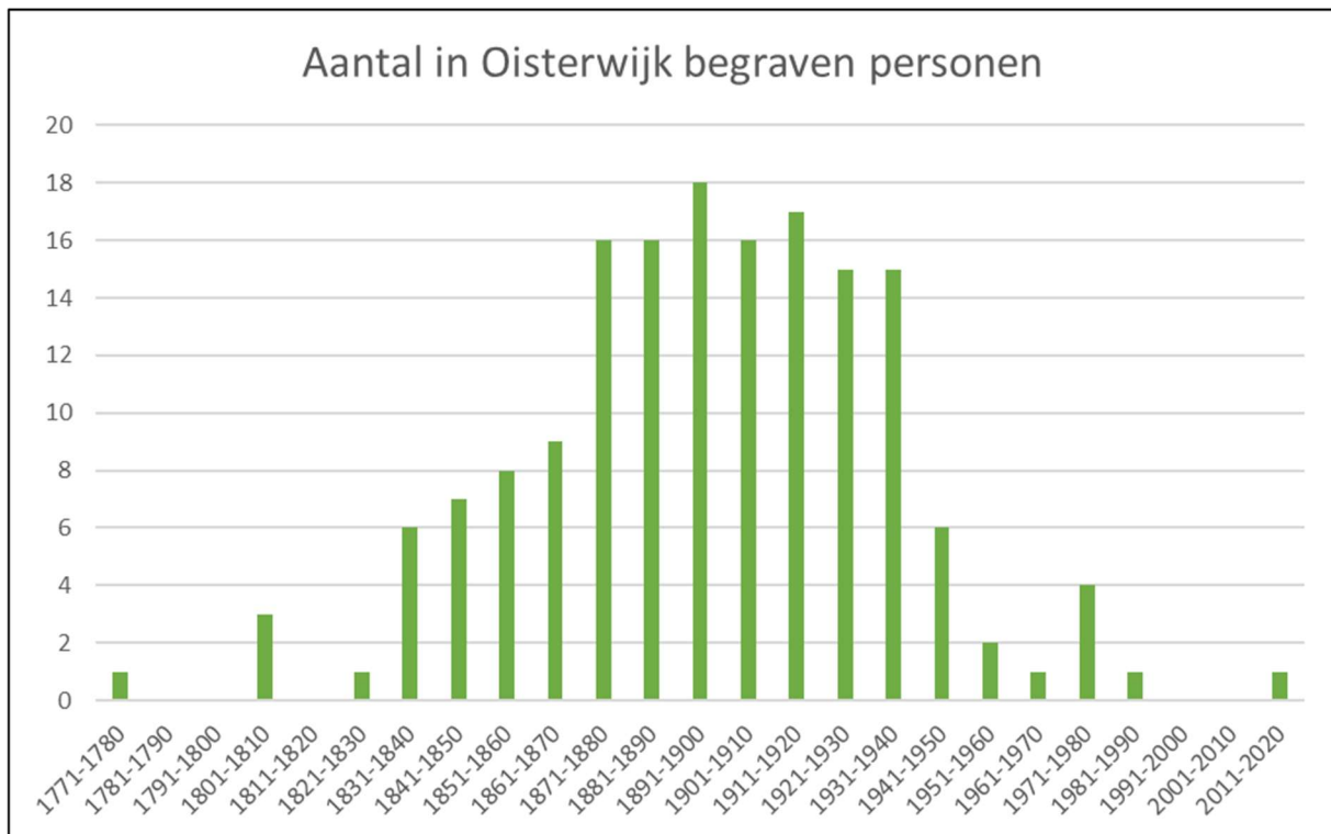
Tabel 2 Aantal begraven personen per periode van 10 jaar.

In de periode 1871 tot 1940 zijn verhoudingsgewijs de meeste personen begraven. Gemiddeld ruim 16 personen per tien-jaar. Hoewel Tilburg in 1857 een eigen Joodse Begraafplaats in gebruik heeft genomen, heeft dit niet geleid tot een afname van het aantal begraven personen in Oisterwijk.