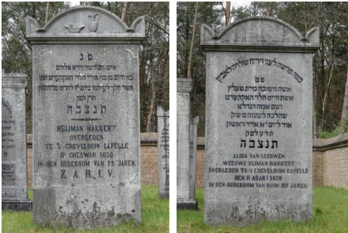
Heyman Hakkert (graf 21)

Zoals gezegd is eeuwige grafrust een van de voorschriften van het jodendom. Toch zijn er uitzonderingen waarop verstoring van deze eeuwige grafrust wel is toegestaan. Bijvoorbeeld als de begraven persoon in Israël herbegraven kan worden. Ook plannen van de overheid kunnen in uitzonderlijke gevallen aanleiding zijn om graven te ruimen en elders te begraven. Bijvoorbeeld in verband met belangrijke infrastructurele projecten of het uitbreiden van woonwijken. Ruimen en herbegraven zal wel altijd onder rabbinaal toezicht moeten plaatsvinden.